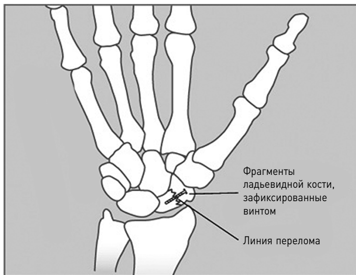
Так выглядит винт в ладьевидной кости на рентгеновском снимке

Возможно, мне просто не везет. Людей, подобных мне, обычно называют подверженными травмам, хотя я склонен подозревать, что к таковым относятся все люди, занимающиеся каким-либо видом спорта. За несколько лет до велосипедной травмы, играя на третьей базе за команду своей больницы по софтболу*, я бросился за низко летящим мячом и услышал тревожный треск в задней части моей голени. Я почувствовал резкую боль, и в скором времени гиперемия кожного покрова чуть выше задней части лодыжки указала на наличие кровоизлияния. Выяснилось, что я порвал подошвенную мышцу — небольшую мышцу голени, относящуюся к задней группе. Целый месяц я провел на больничном. Костыли (потом трость) и унижение стали