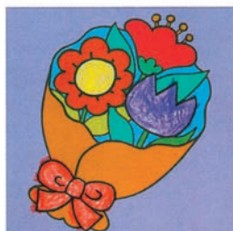
▲ В последних заданиях тетради ребёнок закрашивает белые области аккуратно, стараясь не выходить за гра

Не обращайте внимания на то, что ребёнок выходит за границы белой области. Также не стоит расстраиваться, если малыш закрасит её не полностью.