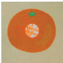
▲ Первый опыт ребёнка.

Сначала ребёнок будет выполнять лёгкие упражнения на раскрашивание. Постепенно сложность заданий возрастает. Белые области окружены цветным фоном, поэтому рисунок будет выглядеть аккуратно, даже если ребёнок выйдет за границы. Когда малыш привыкнет держать карандаш, у него будет получаться всё лучше и лучше.