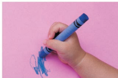
▲ Здесь ребёнок держит карандаш уверенно, но не совсем правильно. Вы можете показать малышу, как нужно держать карандаш, когда ботать.

Лучший способ держать восковой карандаш — сжимать его ближе к заострённому концу, тогда карандаш не сломается. Следите за успехами ребёнка и позволяйте ему приобретать новое умение постепенно, шаг за шагом.