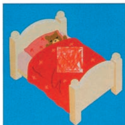
▲ Малыш работает карандашом более уверенно.