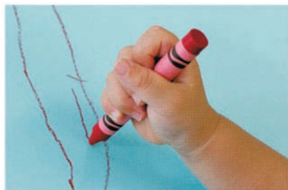
▲ Первое время ребёнок сжимает карандаш в кулаке.

Не переживайте, если поначалу малыш будет сжимать карандаш в кулаке. Однако со временем вы должны научить ребёнка держать карандаш правильно.