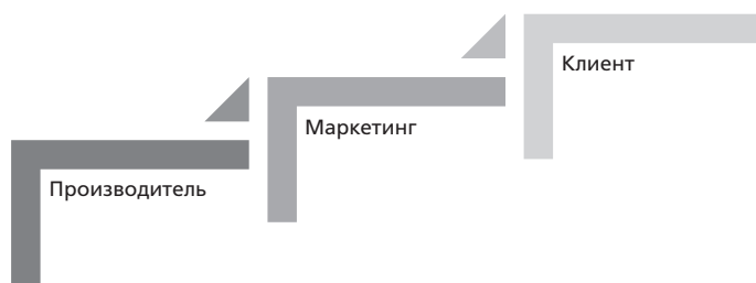
Рис. 1.1. Три этапа эволюции экономических отношений

Западные компании еще в середине XX века столкнулись с необходимостью изменить свое восприятие роли Клиента и сформировать к нему новый подход. Так пришло время вывести бизнес на очередной, новый уровень развития, и называется эта концепция — СЕРВИС .