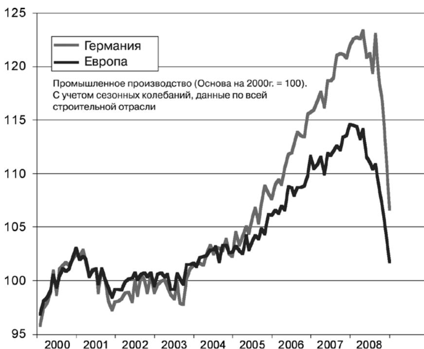
Рис. 1. Стремительный рост, стремительный спад 11

2008 года объем производства вырос с 12,6 до 16 млрд долл., то есть на 27%. Однако за этим последовал стремительный спад, когда за несколько недель отсутствие новых заказов и отмена старых привели к сокращению производства на 30% – с 535 до 375 самолетов 10 .