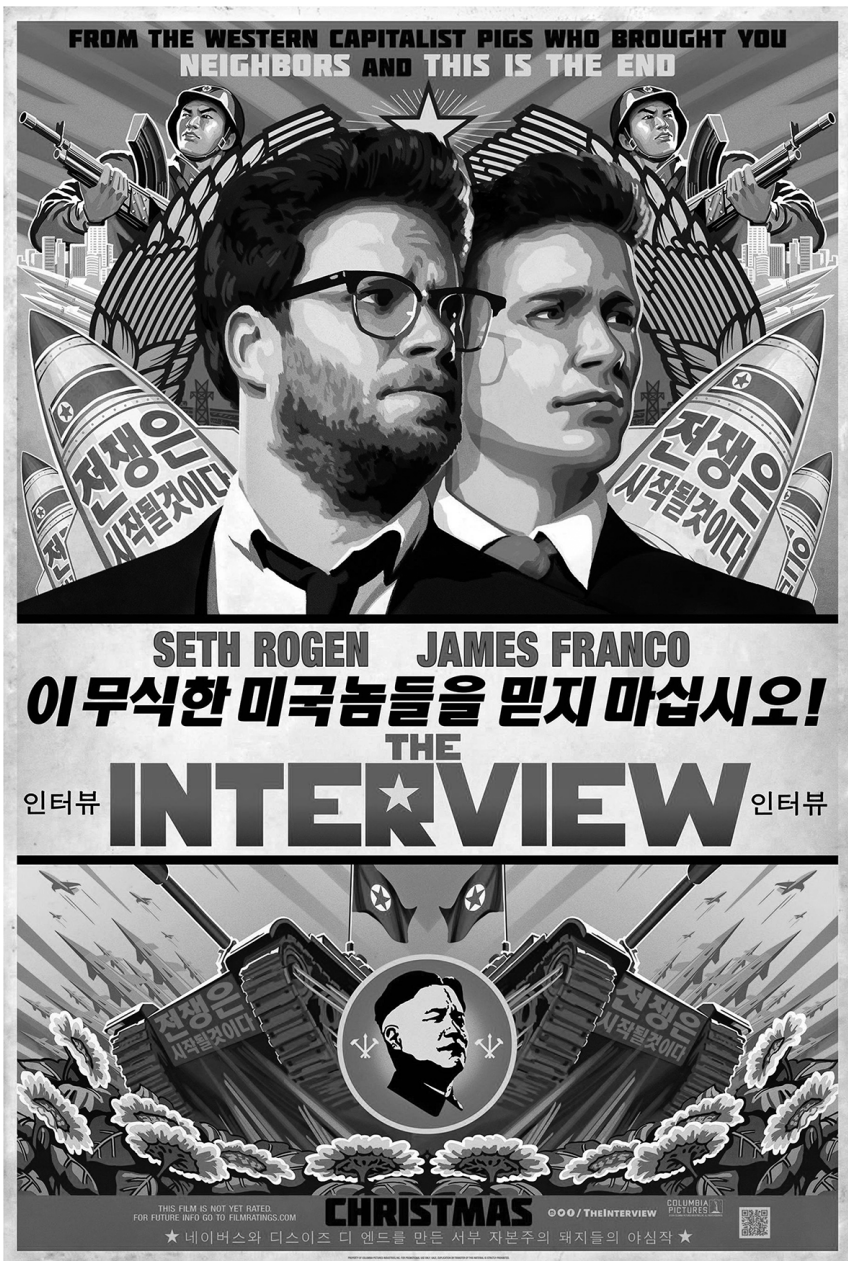
Плакат фильма «Интервью» (2014)