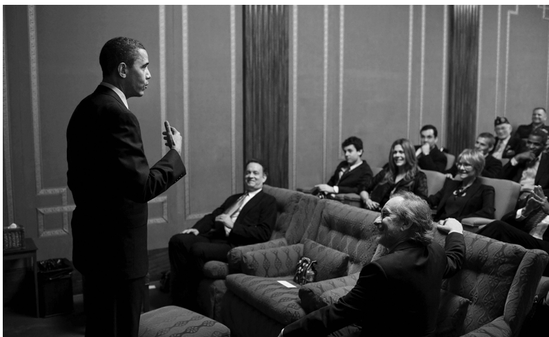
Барак Обама, Стивен Спилберг и Том Хэнкс в кинотеатре Белого дома перед показом мини-сериала «Тихий океан». 11 марта 2010 г.