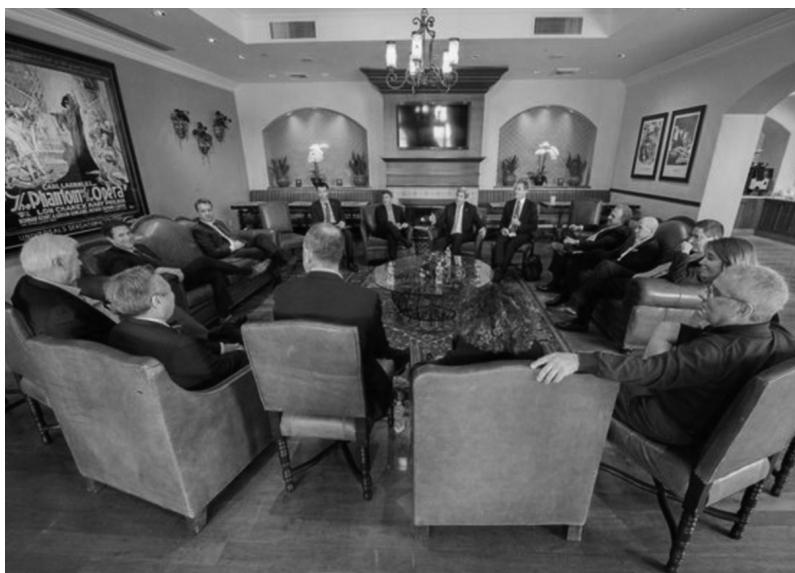
Встреча госсекретаря Джона Керри с главами голливудских студий (фото из Twitter-аккаунта политика)

успешно стали проходить законопроекты, лоббируемые Американской ассоциацией кинокомпаний, а также гильдиями актеров, режиссеров, сценаристов и т. д. В декабре нижняя палата конгресса одобрила Comprehensive Trade Negotiating Authority Act (HR 3019), упрощающий процедуру заключения торговых договоров на высшем уровне. Затем последовало принятие Independent Film and Television Production Incentive Act (HR 3131), направленного на поддержку кинопроизводства с привлечением капитала американских компаний 8 . Федеральная комиссия по связи не стала ужесточать требования по ограничению доступа к кабельным каналам эротического содержания и правила относительно присутствия насилия в аудиовизуальной продукции, предназначенной для детей. Во всех этих случаях медиаконцерны сохранили много денег, а также получили возможность больше заработать 9 .