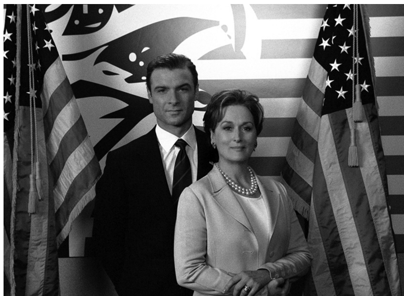
Кадр из фильма «Манчжурский кандидат» (2004)

Перед президентскими выборами 2004 г. жена 42-го президента, занимавшая на тот момент сенаторское кресло, считалась одним из наиболее вероятных соперников действующего главы государства на выборах, но не стала выдвигаться. За три месяца до голосования кинокомпания Paramount, ранее организовавшая встречу советника Джорджа Буша-младшего с кинобоссами Голливуда, выпустила в американский прокат