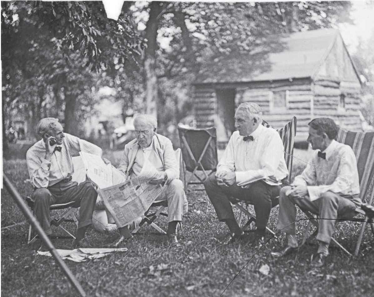
Генри Форд, Томас Эдисон, Уоррен Гардинг и Гарви Файрстоун — титаны автомобильной индустрии во время совместного отдыха в лагере в Пайквилле, Мэриленд.