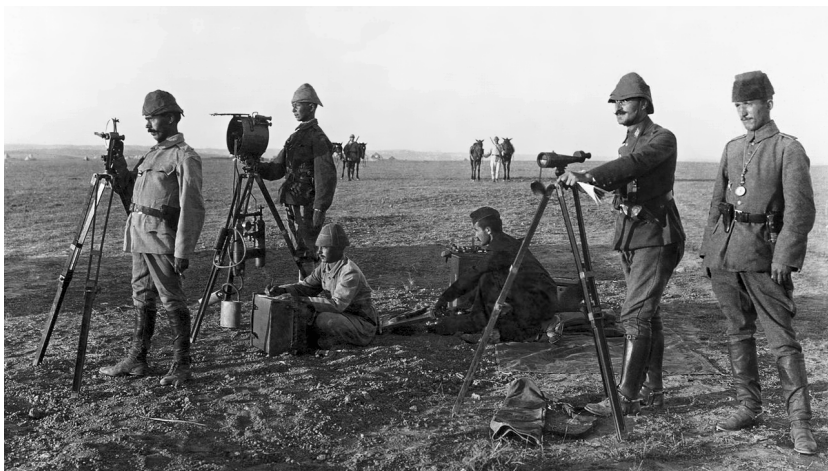
Использование гелиографа в годы Первой мировой войны. Турецкая армия, 1917 г.

В технике связи гелиограф — это оптический телеграф, устройство для передачи информации на расстояние посредством световых вспышек. Главной частью гелиографа служит закрепленное в рамке зеркало, наклонами которого производится сигнализация серией вспышек солнечного света (т. е. «солнечным зайчиком») в на-