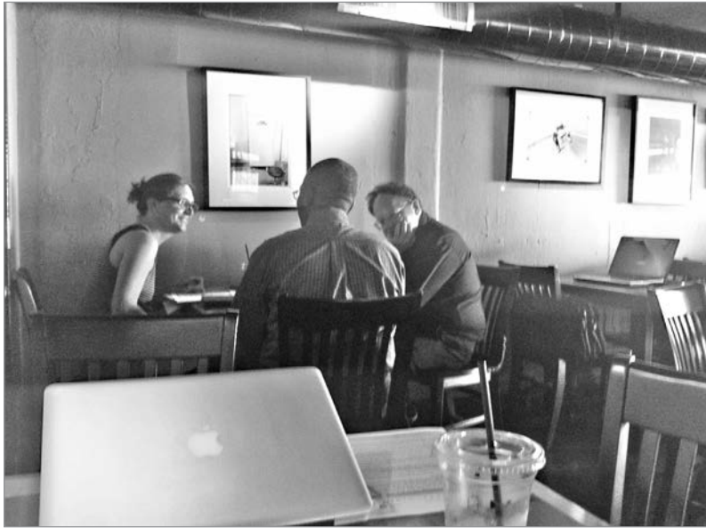
Рис. 8.2. Партизанское исследование пользователей в Кафе 1; руководитель группы слева, Участник сидит лицом к стене, заказчик справа