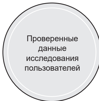
Рис. 8.1. Проверенные данные исследования пользователей

Проведение малых структурированных экспериментов поможет вам сразу проверить гипотезы о предлагаемой ценности и инновационных ключевых аспектах взаимодействия на самих пользователях. В этой главе мы сосредоточимся на получении результатов, которые станут основой для практических действий, у потенциального потребительского сегмента посредством партизанского исследования пользователей. Мы используем прототип из главы 7, чтобы приблизиться к истине с открытым сердцем и умом и услышать от потенциальных клиентов, что они думают о базовом опыте взаимодействия с продуктом. В этой главе основное внимание уделяется принципу 3: проверенные данные исследования пользователей (рис. 8.1), и в ней используется инструментарий UX Strategy Toolkit.