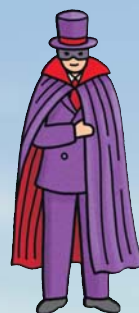
Мистер Икс неуловимый вор