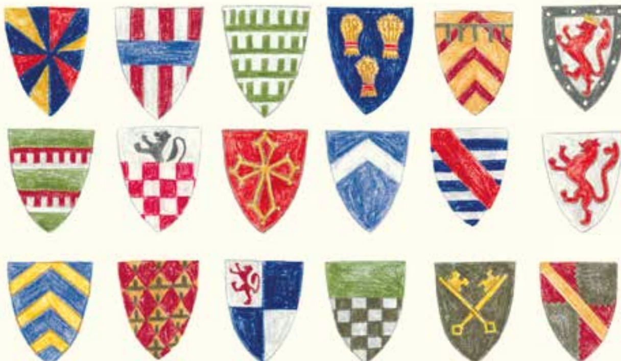
Гербы знатных семейств