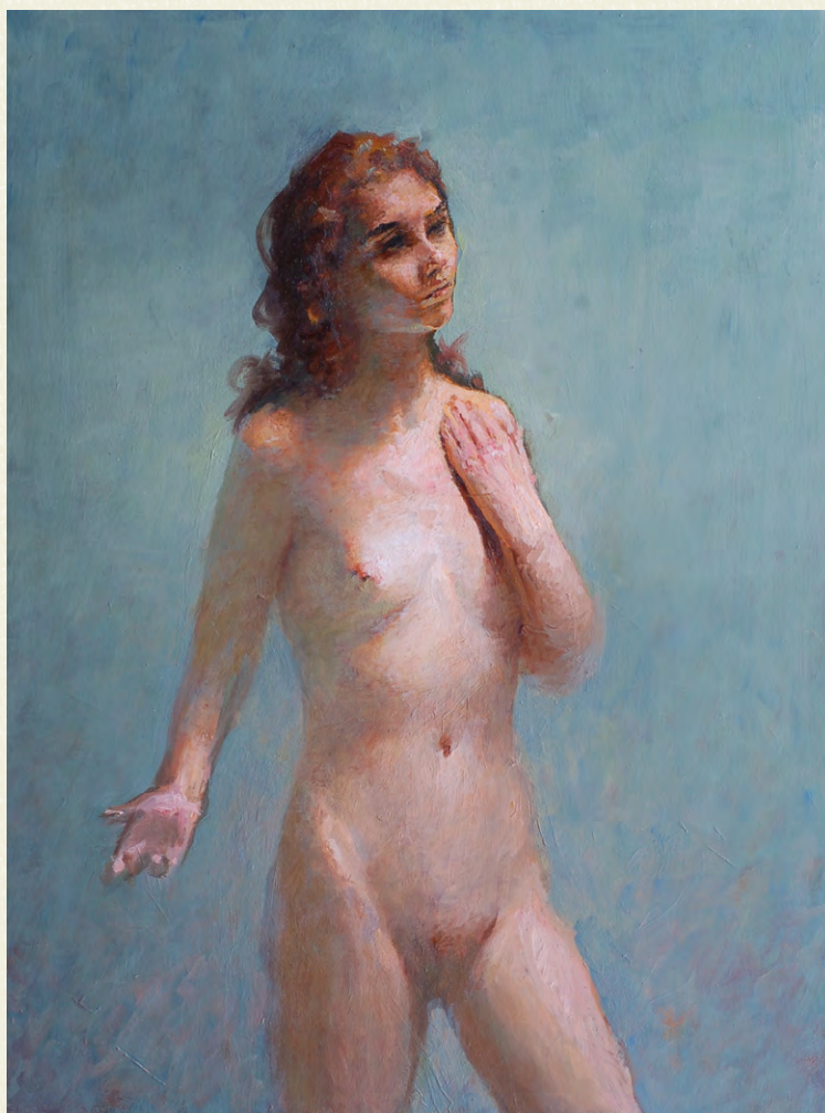
ГРЕГ КРОЙЦ. СТОЯЩАЯ ОБНАЖЕННАЯ. 2014. ДЕРЕВО, МАСЛО. 40,6×30,4 CM

Шаг 4 (свет). Прописка света. Светлый телесный цвет я смешал из кадмия желтого светлого, кадмия красного среднего, белил и ультрамарина синего.