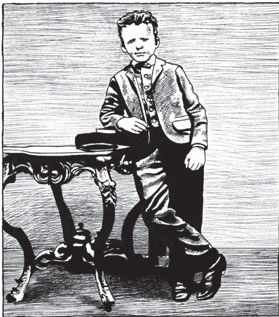
ТЕО В ДЕТСТВЕ

Винсент — ребенок непослушный и обидчивый, у него часто случаются припадки гнева, которые надолго запоминаются. Он тяготеет к одиночеству и при каждом удобном случае уходит подальше от дома и деревни, на пустырь, к каналам. Природа — его утешительница. Мальчик ищет жуков и собирает их в банку. Это его главная страсть — сомнений нет.