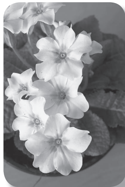
Черно-белая версия фотографии первоцветов с предыдущей страницы.

Контраст осенних оттенков (красно-коричневые и золотые) и летних (желтые и зеленые) — подходящий пример создания настроения. С осенью ассоциируются красный, оранжевый и фиолетовый — гармоничное, жизнерадостное сочетание. Я никогда не использую черный и коричневый. Мне кажется, они сводят на нет все усилия вдохнуть в рисунок жизнь и свет. Для выбора естественной гаммы понаблюдайте цвета природы на натуре при дневном свете.