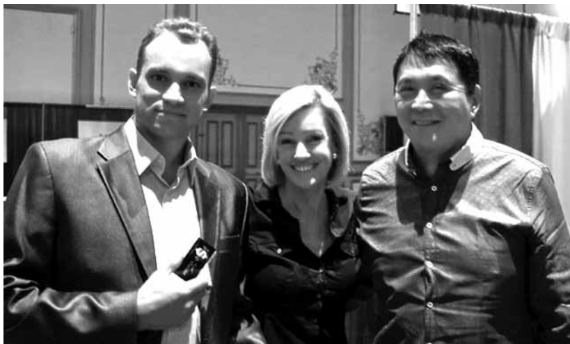
Первая встреча с Робертом и Ким Кийосаки в Лас-Вегасе в 2010 году.

Потом сбылась еще одна моя мечта — я снялся в кино. В фильме «Прямо в сердце» я провел три дня на съемках и появился на три секунды на экране! А дальше — больше. Я понял, что напрасно злился на Роберта Кийосаки, и поехал сказать ему об этом лично. Это было в 2010 году, потом я встречался с ним еще в 2012 и 2015. Знакомство с Кийосаки сильно изменило мою жизнь, равно как и его книга. Я понял, что, имея деньги, можно не только реализовывать свои мечты, но и учиться у людей, которые тебя вдохновляют. Еще одним учителем, с которым мне удалось познакомиться лично, стал Брайан Трейси. Я, конечно же, читал его книги, но лично пообщаться с Брайаном оказалось намного интереснее и полезнее!