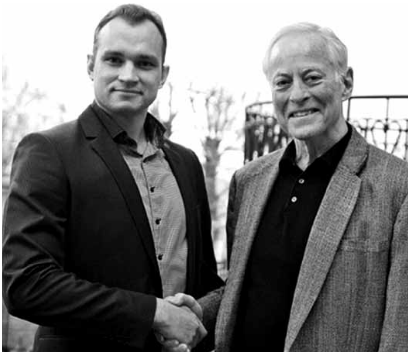
Первая встреча с Брайаном Трейси в 2013 году.

После всех этих историй знакомые начали спрашивать: «Как ты это делаешь?» У меня появились первые ученики, которым я передал свой опыт и подходы к управлению деньгами. Потом, когда учеников становилось все больше, я разработал целую систему обучения личным финансам и назвал ее «Клуб Миллионеров».