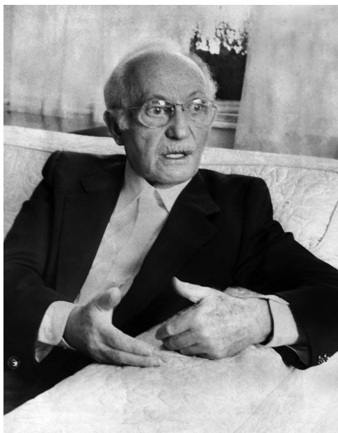
Ли Страсберг, ок. 1979.