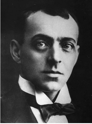
Евгений Вахтангов. Русский актер/режиссер (1883–1922), в честь которого был назван Государственный академический театр