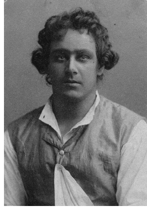
Ричард Болеславский в «Хозяйке гостиницы» Карло Гольдони. МХТ. Москва, 1914