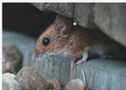
Вібриси – важливі органи чуття