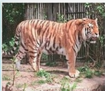
Закавказький тигр, вимер у 1970-х рр., Середня Азія, північ Ірану, Кавказ