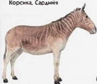
Квага, вимерла в 1883 р., Південна Африка