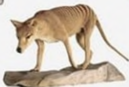
Сумчастий вовк, вимер у 1936 р., Тасманія, Австралія