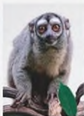
Міриона веде нічний спосіб життя