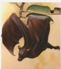
Гуамська летюча лисиця, вимерла в 1968 р., Гуам (Тихий океан)