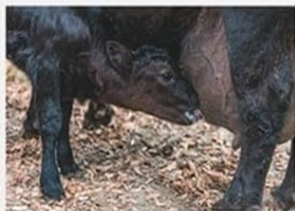
Теля, що смокче молоко матері