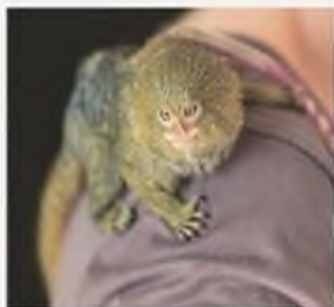
Карликова ігрунка — найменша мавпочка