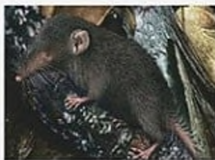
Білозубка острова Різдва, вимерла в 1985 р., острів Різдва (Індійський океан)