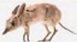
Свиноногий бадикут, вимер у 1950 рр., Австралія