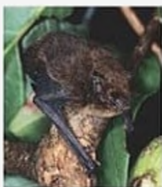
Нетопір острова Різдва, вимер у 2009 р., острів Різдва (Індійський океан)