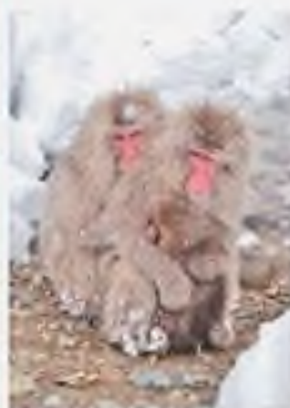
Японський макак — «найпівнічніша» мавпа