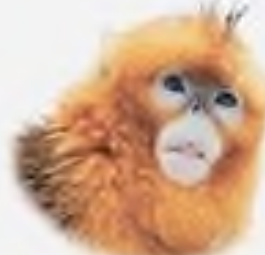
золотиста хирпоноса мавпа