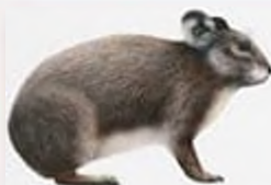
Сардинська півкуха, вимерла в 1774 р., Корсика, Сардинія