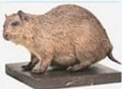
Остріва хутія, вимерла в 1950-х рр..