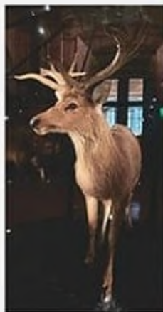
Олень Шомбургка, вимер у 1938 р., Таїланд