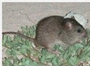
Рифовий мозаїчнохвостий щур, вимер у 2000-х рр., острів Брембл-Кей, Нова Гвінея